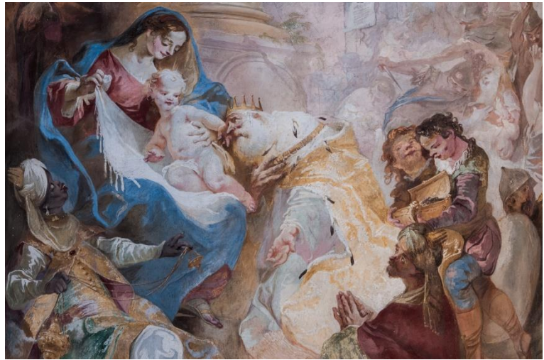
Nagy Gábor fotói